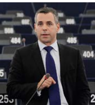
» Diese rechtsverbindliche Zusage hat die EU-Kommission nicht erfüllt. «

Das Europaparlament hatte dem Vertrag nur unter dem Vorbehalt zugestimmt, dass die EU innerhalb eines Jahres einen Rahmen für die eigene EU-Datenanalyse setzt. „Diese rechtsverbindliche Zusage hat die EU-Kommission nicht erfüllt“, kritisierte der FDP-Europaabgeordnete Alexander Alvaro. [...]