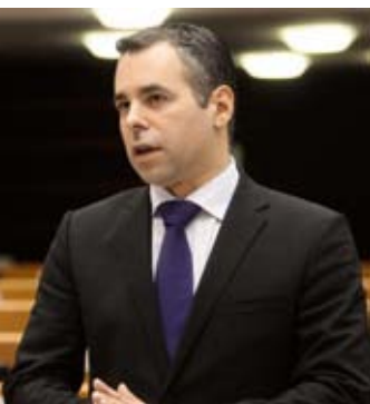
» Es ist unsere Aufgabe, den Finger in die Wunde zu legen. «