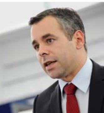
» Andere Mittel und Wege finden, um die Kommission zur Auskunft zu bewegen. «