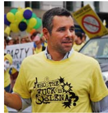
» Wildwuchs an nationaler Willkür. «

„Aus der Evaluation wird ersichtlich, dass die ursprünglich europaweit vorgesehene Harmonisierung und Einführung der Vorratsdatenspeicherung kläglich gescheitert ist“, sagte Alexander Alvaro, innenpolitischer Sprecher der FDP im Europaparlament. Statt einer europaweiten Angleichung der Datenspeicherung seien die Gesetzeslagen in Europas Mitgliedstaaten unübersichtlich, was zu einem „Wildwuchs an nationaler Willkür“ geführt habe. In manchen Ländern greife die Küstenwache auf die Vorratsdaten zu, in anderen reiche für Sicherheitsbeamte ein schriftlicher Beleg, damit sie die privaten Daten der Bürger einsehen dürften. Auch bei den Zugriffszahlen gebe es eklatante Abweichungen. So seien die polnischen Behörden alleine für die Hälfte der jährlich circa zwei Millionen europäischen Zugriffe auf Vorratsdaten verantwortlich.