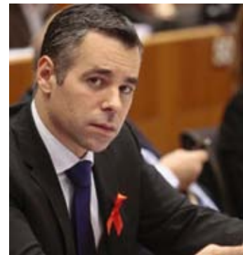
» Das Internet stützt sich auf zwei Säulen: Offenheit und Transparenz. Dies muss auch mit Blick auf den Netz- und Dienstzugang gelten. «