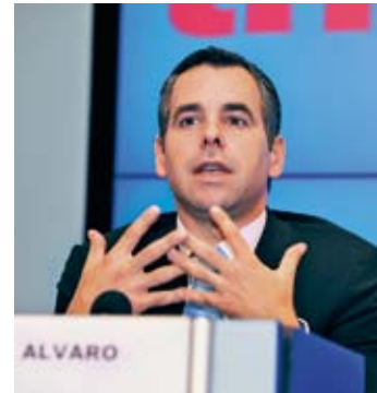
» Verpflichtende Netzsperrern sind endgültig vom Tisch. «