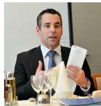
» Es sieht so aus, als wolle der Innenminister nur bestimmte Anti-Terror-Maßnahmen und die Verlängerung der Sicherheitsgesetze rechtfertigen. «