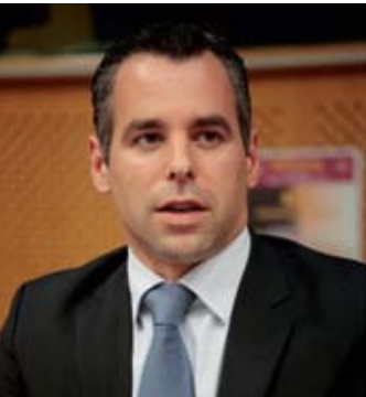
» Sitzungen in Straßburg sind teuer, ineffektiv, eine Belastung für die Umwelt und ein gefährlicher Stress für Abgeordnete wie Mitarbeiter. «