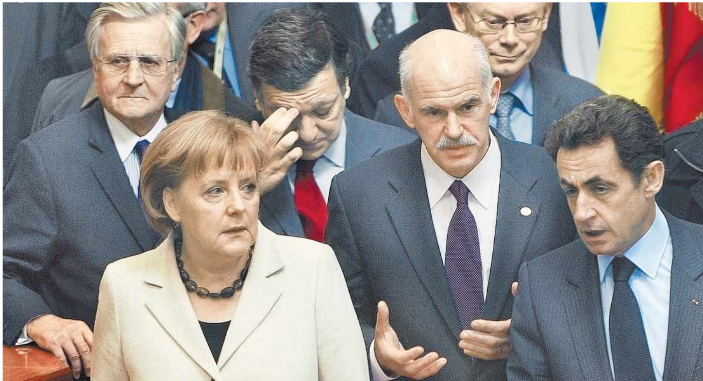
Durch dick und dünn: EZB-Präsident Trichet, Kanzlerin Merkel, Kommissionschef Barroso, Premier Papandreou, Ratspräsident Van Rompuy und Präsident Sarkozy (v. l.)

Regierungen geben Garantie für Pleitestaaten ab · Kein Beschluss zu Griechenland-Hilfen